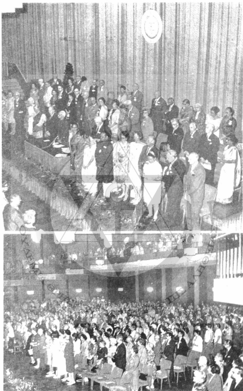
Άνω: Τò Παγκόσμιον Προεδρείον τοῦ Συνεδρίου. Κάτω: Μία ἄποψις τῆς αἰθούσῃς.