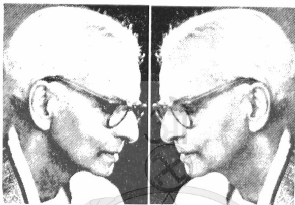
Ν. ΣΠΙ ΡΑΜ