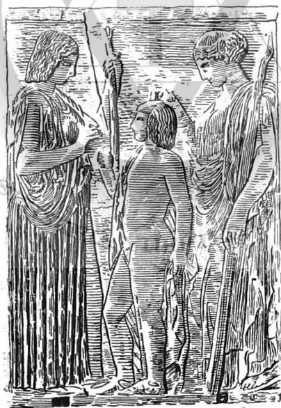
Ἡ μῦθις τοῦ Τριπτολέμου

Ἄλλὰ τὸ πολὺ περίεργο ἐδῶ εἶναι ὅτι αὐτοὺς τοὺς ἴδιους, ἀπὸ τὴν ἄλλῃ μεριά, θαυμάζει ἢ σύγχρονος διανόησι σάν μεγά- λους σοφοῦς, ποὺ ἀνοιξαν δρό- μους γιὰ τὸ ἀνθρώπινο πνεῦμα, ποὺ ἐδημιούργησαν τὸ λεγόμε- νον «Ἑλληνικὸν Θαῦμα», τὸ ὁ- ποῖον ἀπὸ τὰ βάθη τῶν αἰῶνων φωτίζει καὶ σήμερ' ἀκόμη τὴ σκέψι τῆς ἀνθρωπότητος... Καὶ τιμᾶ τὰ μεγάλα ὀνόματα τοῦ Πυ- θαγόρα, τοῦ Δημοκρίτου, τοῦ Πλάτωνος καὶ τῶσων ἄλλων.