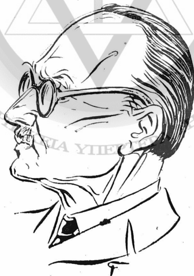
Ν. Καζαντζάκης (σκίτσο Γεορ. Γρηγόρη)

Λοιπόν, «ὅλες οἱ θητεῖες» εἶναι ὅλα ὅσα ὁ ἄνθρωπος ἐπινοεῖ γιὰ νὰ ἐξωραΐση τὴ ζωὴ του και τὸ μεγάλο Ἄγνωστο. Και ὁ «τετελειωμένος» ἄνθρωπος δὲν τοποθετεῖται σὲ κῆπο παραδείσιο, μὰ σὲ κῆπο βράχων